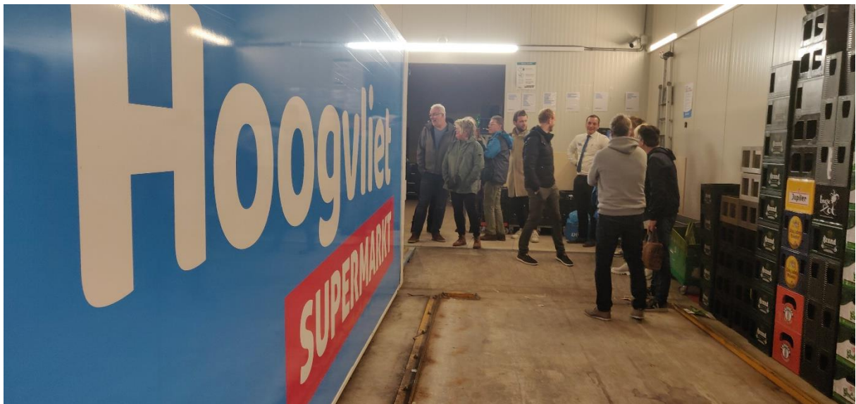
Foto: uitleg bij het laad- en losdock

Bewoners hebben ook gesproken met mensen die direct naast de supermarkt en het laad- en losdock wonen. Zij stonden in de tuin te werken en enkele Hilversummers hebben even een praatje met de bewoners gemaakt. Daar kwam uit terug dat de mate van overlast zeer beperkt is.