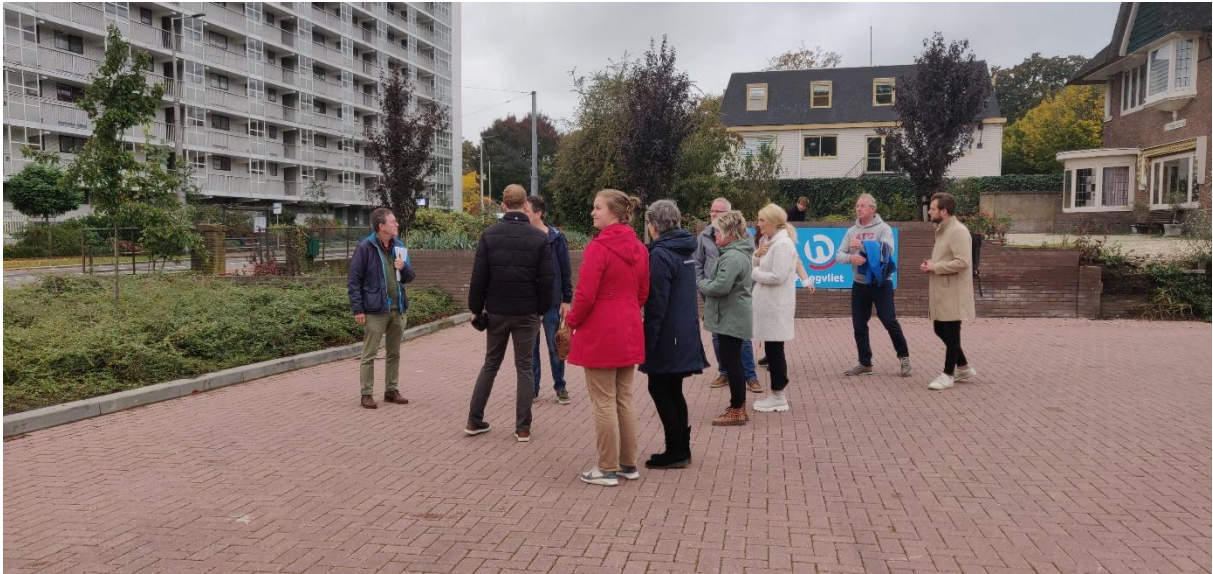
Foto: een deel van de groep bij de toerit van de vrachtauto's. Op de achtergrond een bewoner die men gesproken heeft